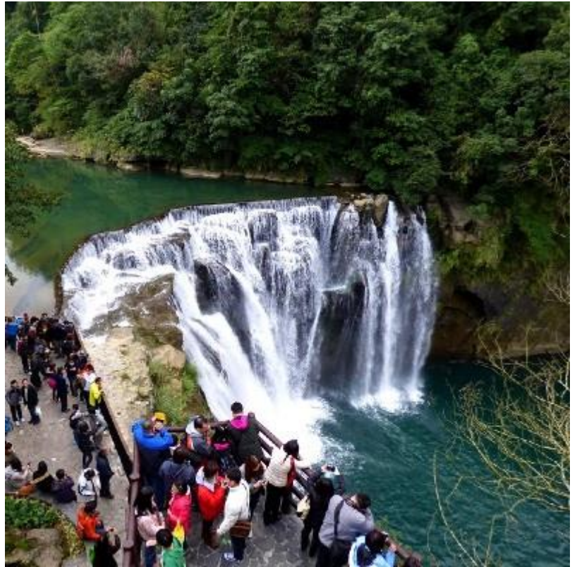
Thác nước Thập Phần