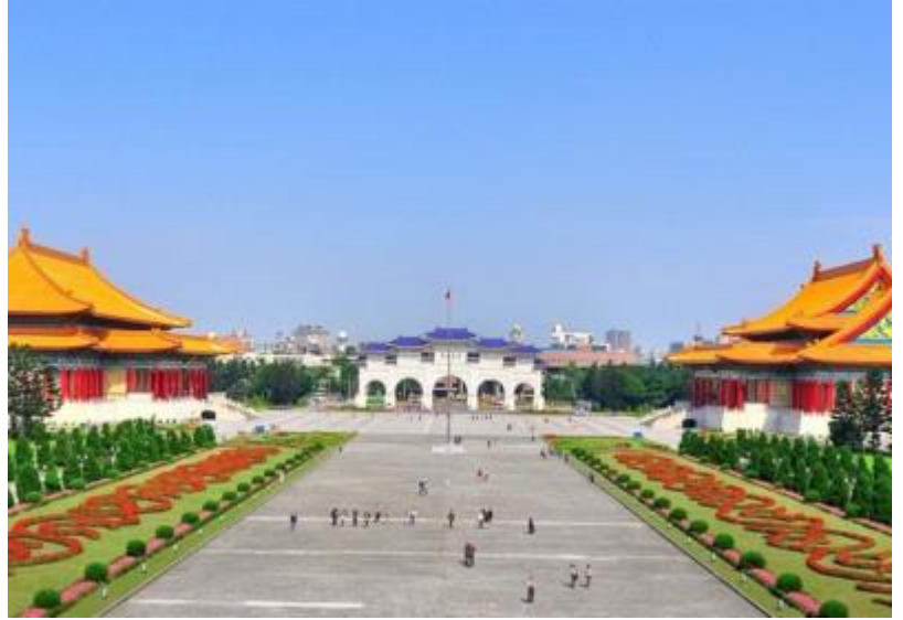
Quảng trường Trung Chính

Tòa nhà cao nhất và là biểu tượng của TP Đài Bắc, mua sắm hàng hiệu với các thương hiệu thời trang, mỹ phẩm nổi tiếng thế giới. ((không bao gồm chi phí lên đỉnh tháp))